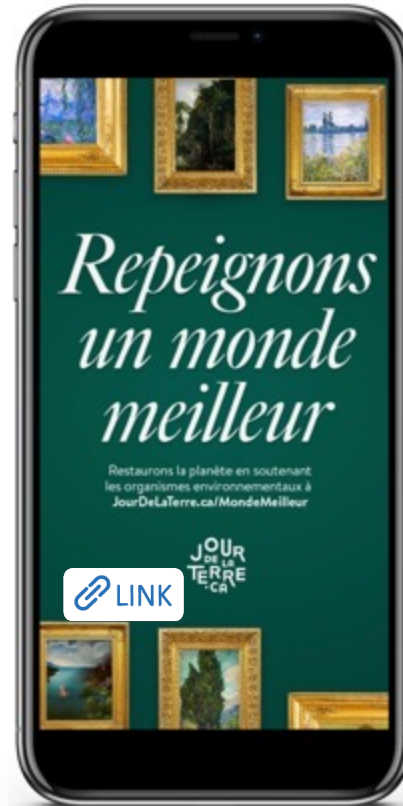
STORY DE FIN